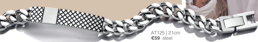
AT125 | 21cm €59 steel