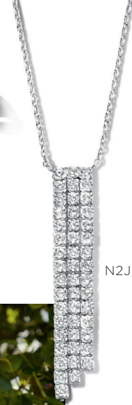
N2J51 € 95