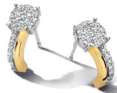
N2N56 € 109