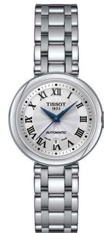
T126 207 11 013 00 BELLISSIMA AUTOMATIC 745 EUR