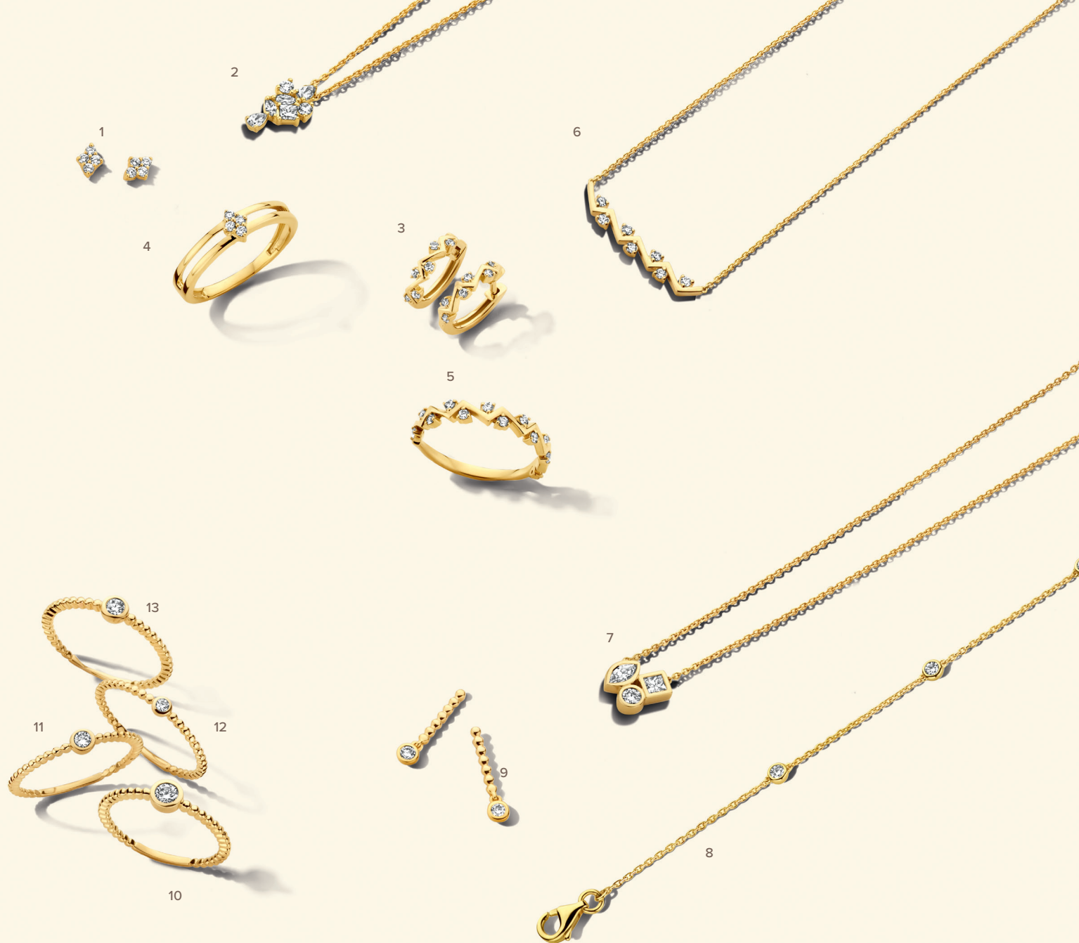
1 • 065239/A € 599 • 2 • 065787/A € 1745 • 3 • 065703/A € 1029 • 4 • 065138/A € 725 • 5 • 065684/A € 1225 • 6 • 065709/A € 935 • 7 • 065418/A € 1415 • 8 • 065081/A € 825 • 9 • 065786/A € 555 • 10 • 91NI35/A € 1135 • 11 • 91NI27/A € 575 • 12 • 91NI22/A € 435 • 13 • 91NI29/A € 719