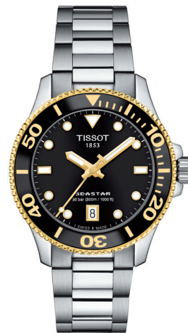
T120 210 21 051 00 SEASTAR 1000 36 MM 425 EUR