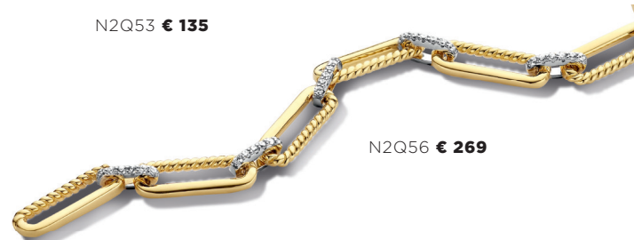
N2Q56 € 269