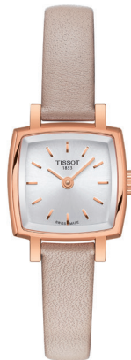
T058 109 36 031 00 LOVELY SQUARE 345 EUR