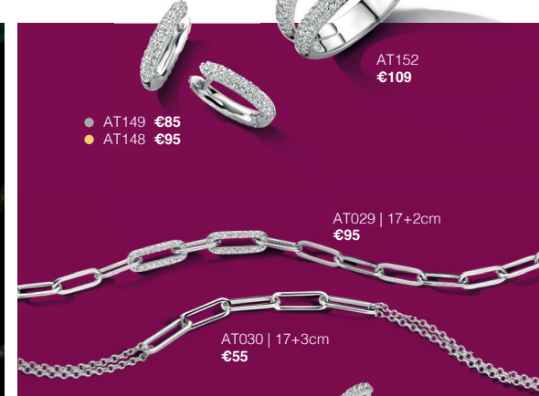
● AT149 €85 ● AT148 €95