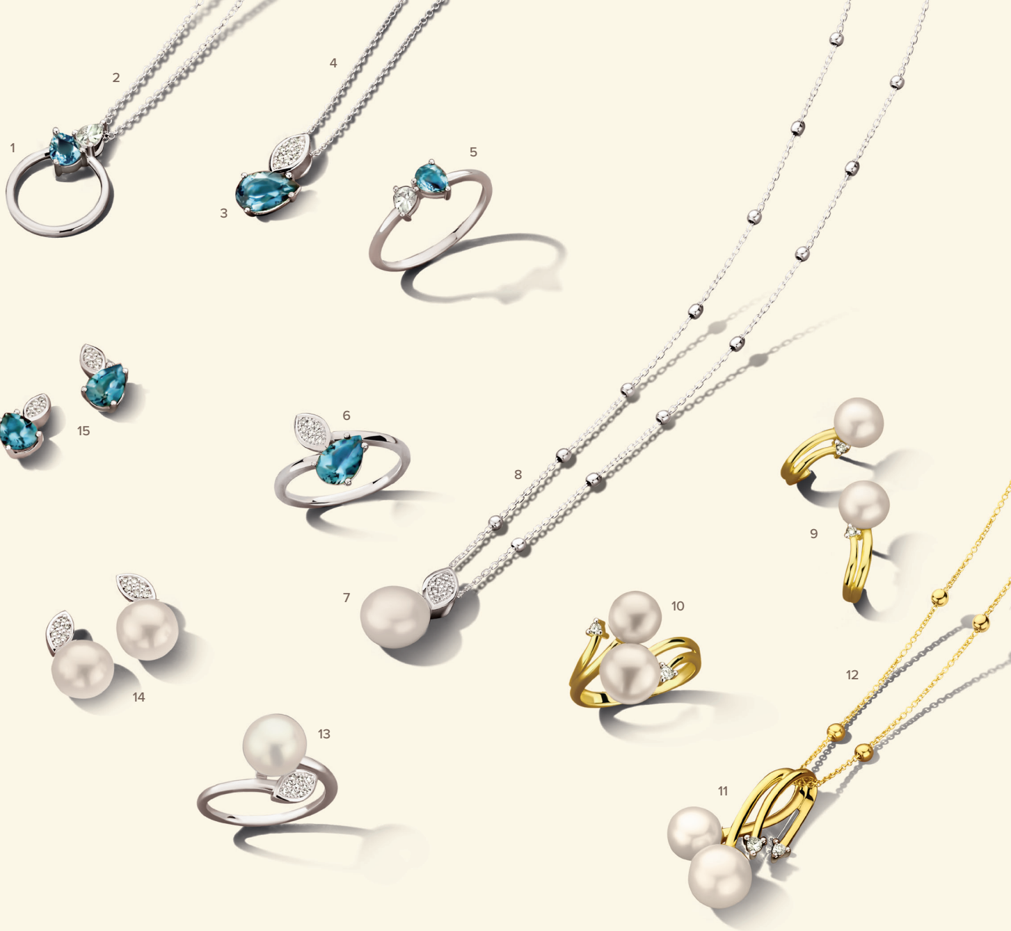
1 • 065893/T € 439 • 2 • FRW090/42 € 255 • 3 • 065573/TA € 655 • 4 • FRW090/42 € 255 • 5 • 065892/T € 485 • 6 • 065572/TA € 1135 • 7 • 065593/PA € 515 • 8 • 059199/42 € 459 • 9 • 065869/PA € 765 • 10 • 065868/PA € 889 • 11 • 065585/PA € 695 • 12 • 059197/42 € 495 13 • 065592/PA € 895 • 14 • 065594/PA € 629 • 15 • 065574/TA € 855