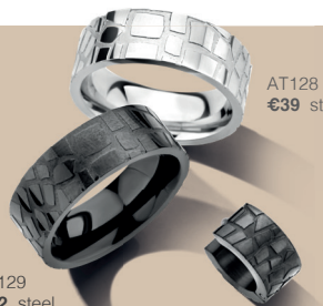
AT128 €39 steel