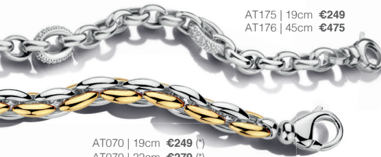
AT070 | 19cm €249 (*) AT070 | 22cm €279 (*)