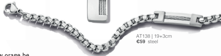
AT138 | 19+3cm €59 steel