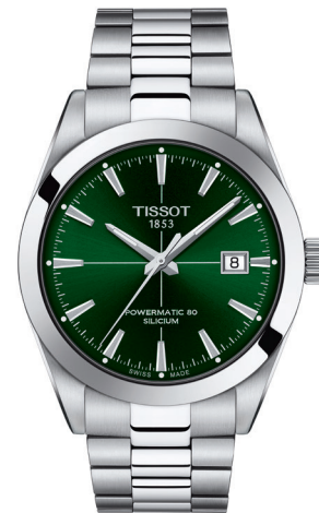
T127 407 11 091 01 GENTLEMAN POWERMATIC 80 SILICIUM 845 EUR