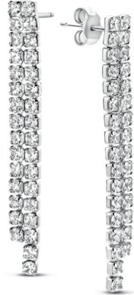
N2J52 € 95