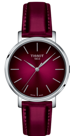
T143 210 17 331 00 EVERTIME LADY 245 EUR