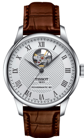
T006 407 16 033 01 LE LOCLE POWERMATIC OPEN HEART 725 EUR