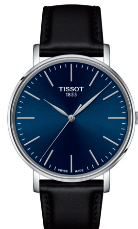
T143 410 16 041 00 EVERYTIME GENT 245 EUR