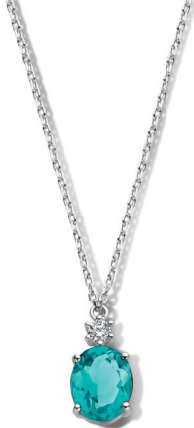
N2L55 € 99