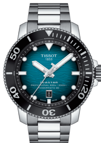
T120 607 11 041 00 SEASTAR 2000 PROFESSIONAL POWERMATIC 80 1145 EUR