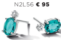
N2L56 € 95