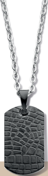
AT123 | 50+5cm €45 steel