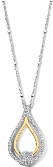
N2N55 € 155