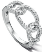
N2K58 € 135