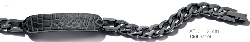
AT131 | 21cm €59 steel