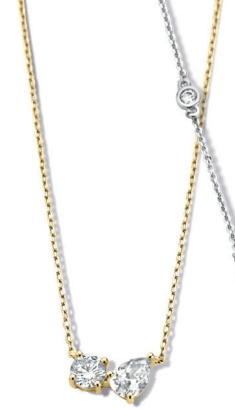
● AT160 | 40+2,5+2,5cm €89 ● AT161 | 40+2,5+2,5cm €69