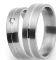
GOUD & TITANIUM OR & TITANE P 24