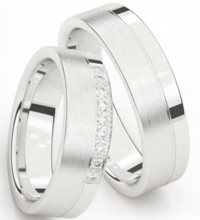
Light Weight 8692-W/60 8691-W/60 8692-WL/60 8691-WL/60