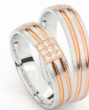
GOUD - BICOLOR OR - BICOLOR P 6-13