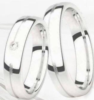
Light Weight 8673-W/50 8673-WL/50 8672-W/50 8672-WL/50