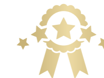
SERVICE GARANTIES GARANTIES DE SERVICE P 24