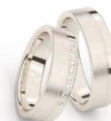
GOUD - CHAMPAGNEKLEURIG OR - CHAMPAGNE P 14