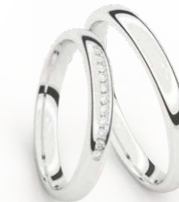
GOUD - WITGOUD OR - OR BLANC P 15 - 21