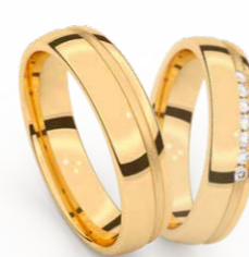
GOUD - GEELGOUD OR - OR JAUNE P 4-5

Bezoek de website voor het volledige aanbod - Visitez le site web pour la gamme complète WWW.AURODESIGN.BE Configureer hier je ring - Configurez votre bague sur WWW.RINGCONFIGURATOR.EU