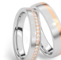
GOUD & EDELSTAAL OR & ACIER INOXYDABLE P 24